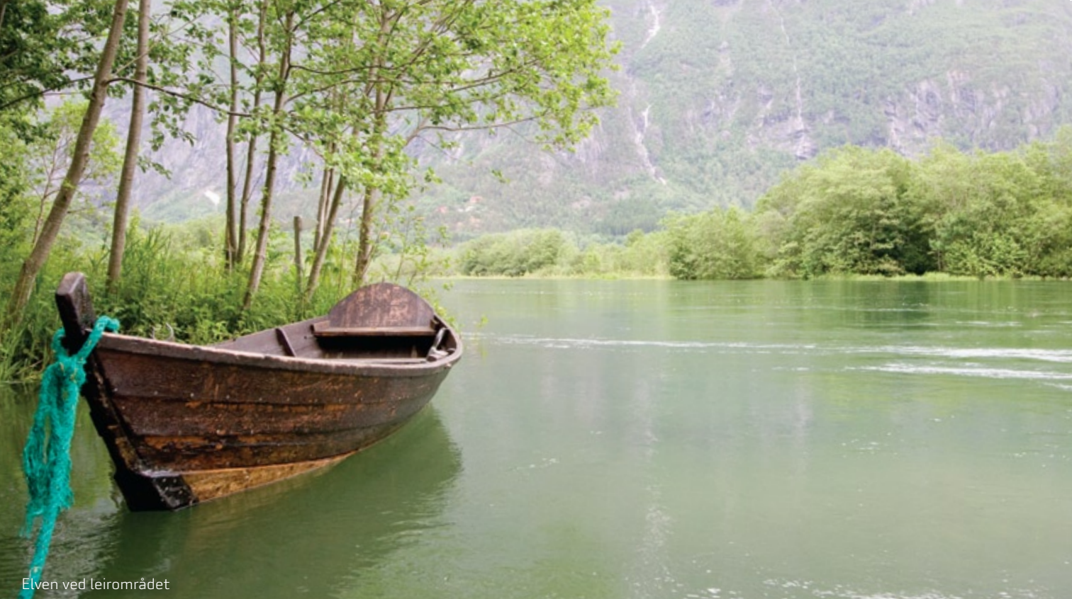
Elven ved leiområdet